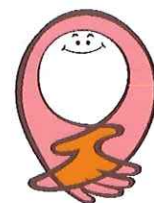
公式キャラクター サポちゃん