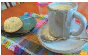
↓焼き菓子の種類も豊富♪