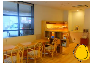
広々としたカフェスペースも魅力のひとつです。

最後に、地域の皆さんに伝えたいことがあればお願いします。 利用者のみんなが粉から作った本格的なパンと香り高いコーヒーを販売しています。是非お越しください。