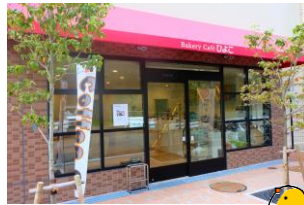
矢上川沿いにあります

ベーカリーカフェひよこの名前の由来は？ もともと、みのり会で宮前区役所前にて地域活動支援センター「パン工房ひよこ」を運営していました。あーる工房へ統合することになり、地域の方に知られていた「ひよこ」の名前を残し、「ベーカリーカフェひよこ」にしました。