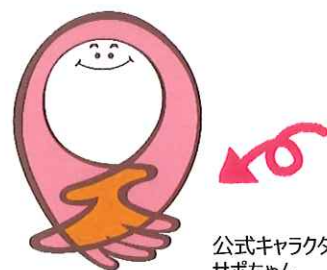
公式キャラクター サポちゃん

「障がい者」は特別な存在ではありません 一人ひとりの「あたたかい気持ち」とちょっとした「お手伝い」だけで、障がいのある人が住み慣れたまちで暮らし続けることへの安心感につながります。 しょうがい者サポーター養成講座では、ちょっとした心遣いや声をかける時に気をつけることなどを分りやすくお話しします。「しょうがい者サポーター」になり、皆さんで優しい街づくりをしませんか。