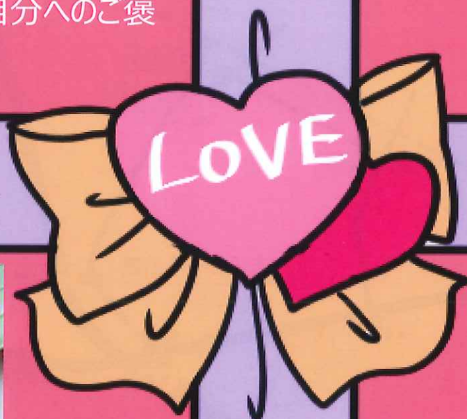
講師作成イメージ