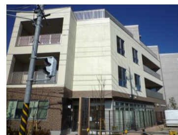
宮前地区会館「まじわーる宮前」外観