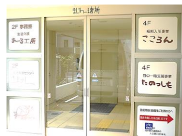
駐車場側の入口より、お入りいただき階段またはエレベーターで2Fへお越しください